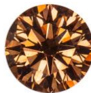
ФОТО ВНЕ МАСШТАБА