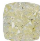
ФОТО ВНЕ МАСШТАБА