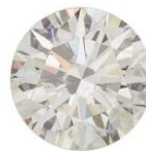
ФОТО ВНЕ МАСШТАБА